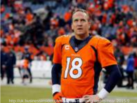
Peyton Manning, chez les Broncos