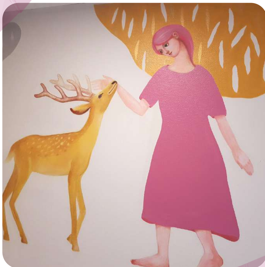
Détail des fresques de l'artiste Victoria Sirooka en Pédiatrie à l'Hôpital Bel-Air.